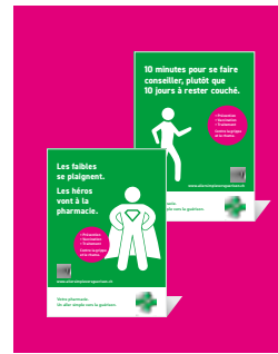
Affiches pour comptoir