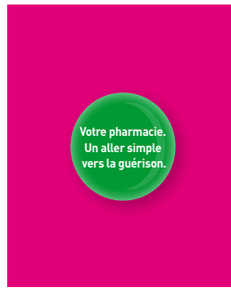
Pins pour votre équipe