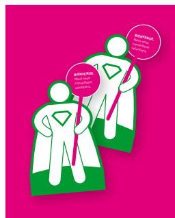
Autocollants pour sol