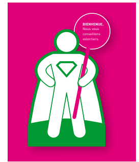
Autocollant pour vitrine