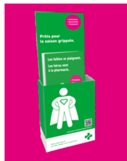
Présentoir avec 50 flyers