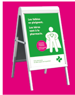
Poster A1 (visuels selon qualification pour la vaccination oui/non)