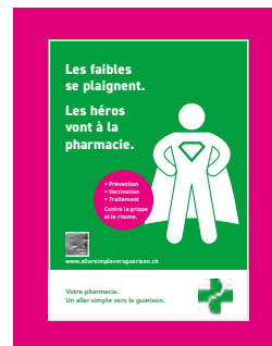
Vitrine 3D livraison, si commande