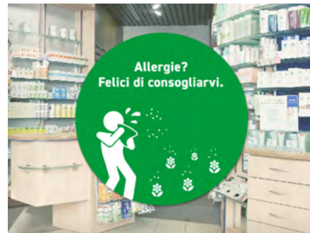
Adesivo per vetrina Tecnologia bubble free: per un'applicazione semplice e pratica