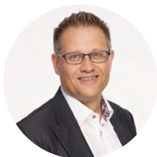
Dr. Lorenz Schmid, farmacista Presidente Unione commerciale nel settore sanitario

A nome di tutto il Comitato direttivo, auguro a noi tutti un buon lavoro in questa fase di implementazione comune. Colgo inoltre l'occasione per ringraziarvi fin d'ora del vostro impegno.