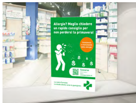
Vetrina Consegna, se ordinata