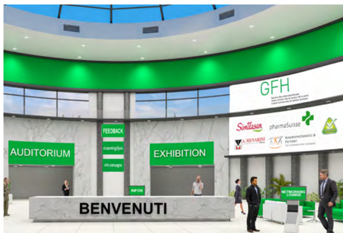
Foyer/reception dopo l'accesso al webinar.