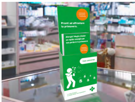
Espositore con 50 flyer