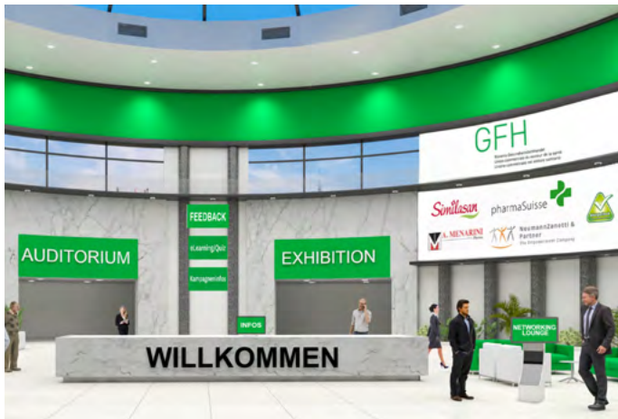
Foyer/Empfang nach Login zum Webinar.