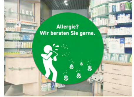
Schaufensterkleber Bubble-Technik: für ein leichtes, unkompliziertes Anbringen