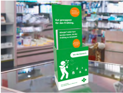
Steller mit 50 Flyer