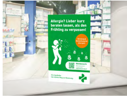
Schaufenstersteller Lieferung, falls bestellt