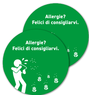
2 adesivi per vetrina Ø 40 cm