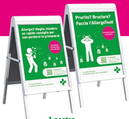
1 poster A1*

La campagna è la più ampia e influente del settore di cui anche lei è parte. Partecipando riceverà il seguente materiale POS: