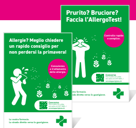
2 locandine A4*