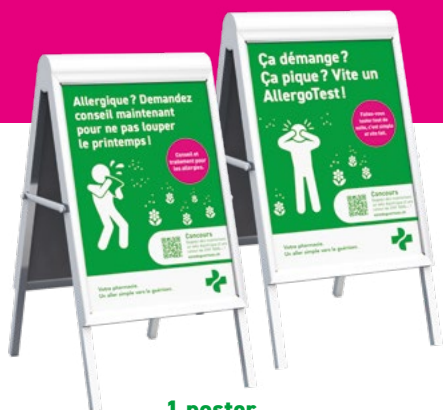
1 poster A1*

Vous aussi, participez à la campagne de sensibilisation la plus importante et la plus influente de notre branche. En participant, vous recevrez le matériel suivant :