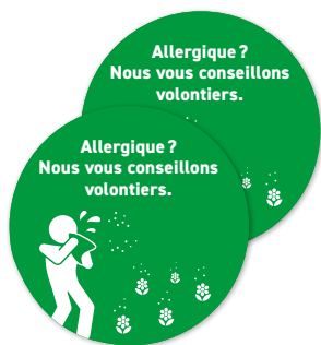
2 autocollants pour vitrine Ø 40 cm