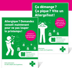
2 affiches pour comptoir A4*