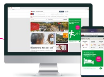
Banner online su diverse piattaforme.