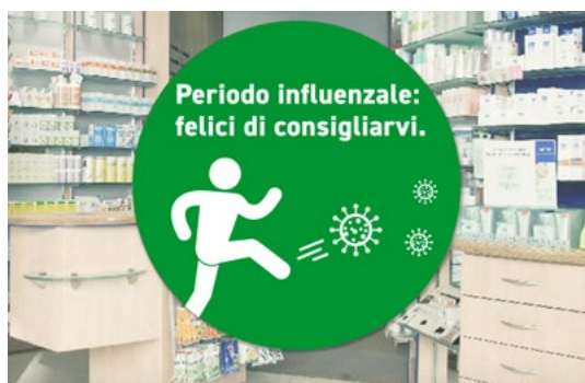
Adesivo per vetrina

Tecnologia bubble free: per un'applicazione semplice e pratica