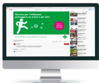
Brevi video su diverse piattaforme digitali.