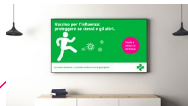
Messa in onda di spot TV.