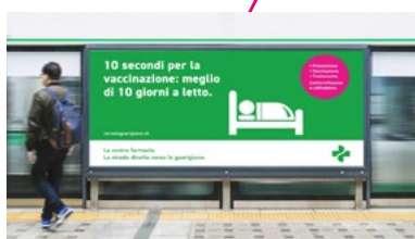
Poster nelle maggiori città svizzere e nelle stazioni.