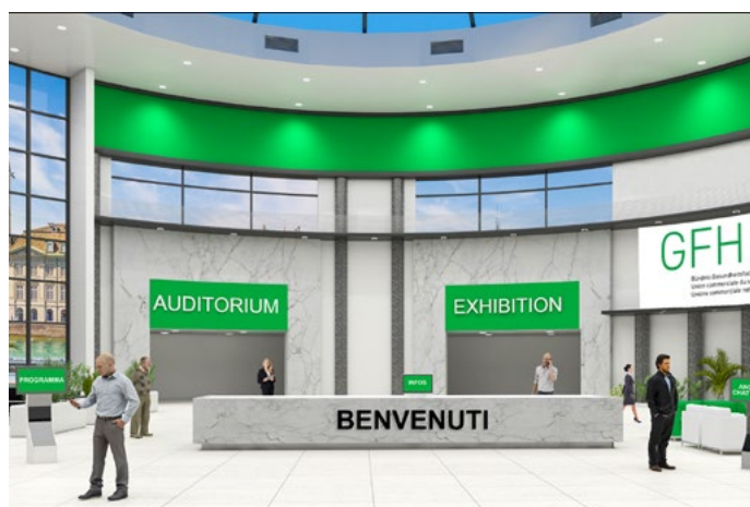
Foyer/reception dopo l'accesso al webinar.