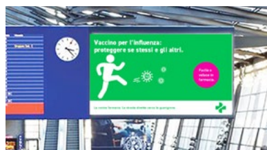
Brevi spot sui trasporti pubblici / nelle stazioni.